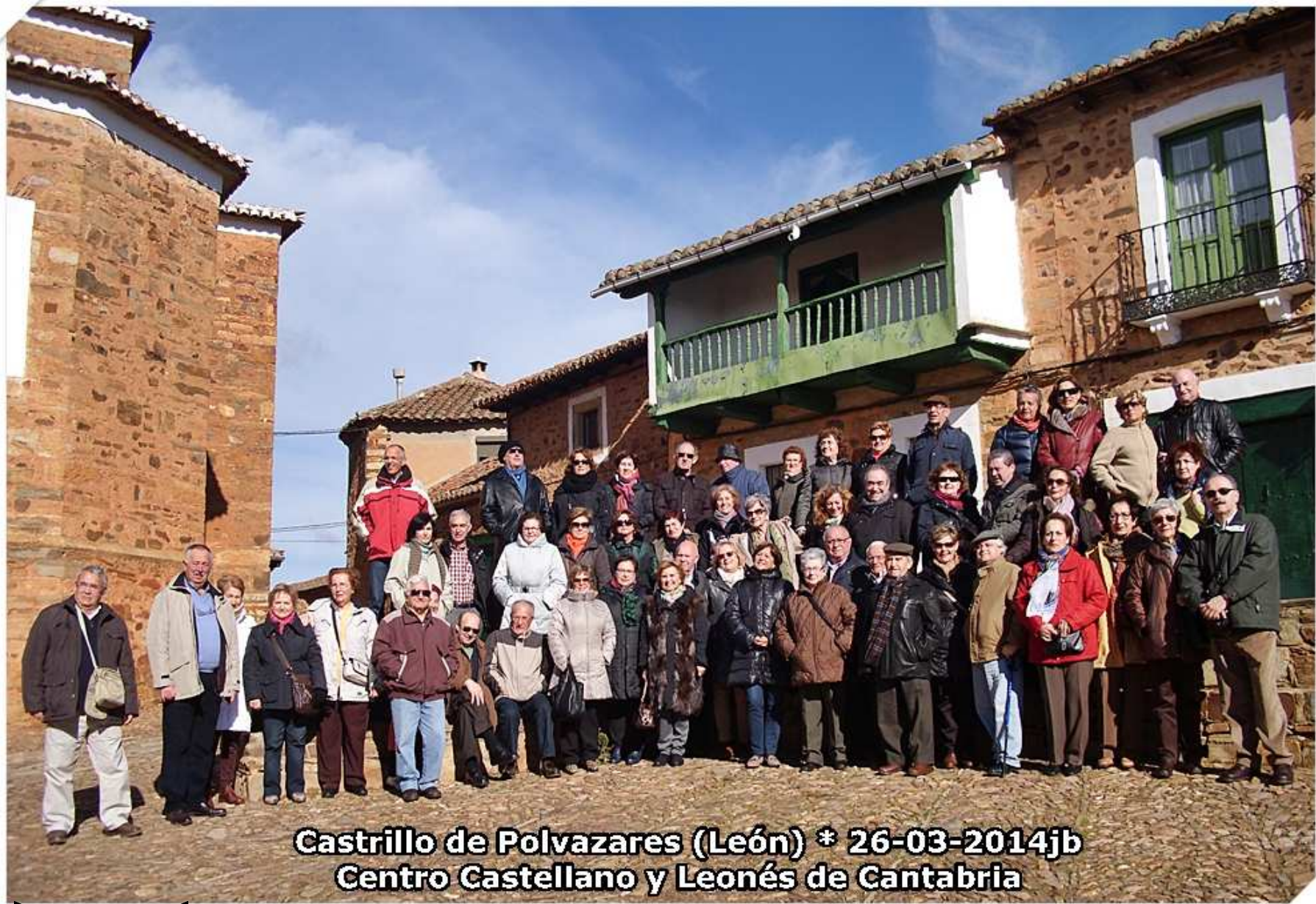
Castrillo de Polvazares (León) * 26-03-2014jb Centro Castellano y Leonés de Cantabria